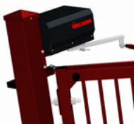
Schneckengetriebemotor mit Zahnkranz.

Die Torpfosten sind aus feuerverzinktem Edelstahl mit RAL-Pulverbeschichtung (gemäß EN ISO 1461), und die Torflügel sind aus Aluminium mit RAL-Pulverbeschichtung. Die Konstruktion ist äußerst stabil, außerdem sind die Tore für das skandinavische Klima optimiert.