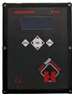
Schaltkasten mit einer Halsang H102 Steuerung und Frequenzmodulatoren