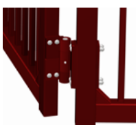
Bearbeitetes Scharnier, belastbar bis 400 kg